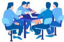
2차 심사 주요 장면